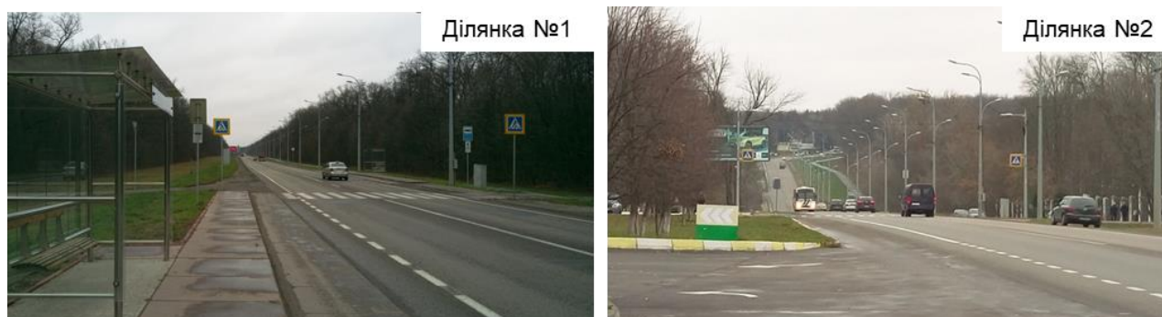
Рисунок 1 – Дорожні умови на ділянках обмеження швидкості

Для встановлення ефективності локальних обмежень швидкості експериментальні дослідження були проведені на вул. Харківське шосе в місті Харкові. Два вимірювальних поста були розташовані на ділянках вулиці, де за допомогою дорожніх знаків впроваджені локальні обмеження швидкості 40 км/год. Третій вимірювальний пост був розташований на контрольній ділянці, яка розташована між першими двома, та не має додаткових обмежень швидкості. Обрана частина вулиці Харківське шосе проходить в лісопарковій зоні міста, має дві смуги руху в обох та узбіччя, тротуари та бордюри відсутні. Суміщена пішохідно-велосипедна доріжка розташована на відстані не менше 10 м від проїзної частини. На обох ділянках обмеження швидкості застосовувалося через наявність нерегульованого пішохідного переходу (рис. 1).