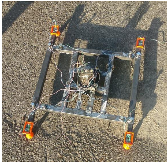
Рисунок 1– Металева конструкція рами крану