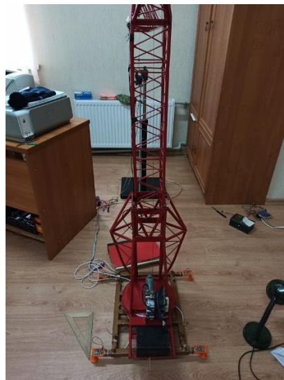
Рисунок 2 – Експериментальна установка – модель крану

Результати проведення експерименту .Результати проведення експериментів використовуючи розроблений вимірювальний комплекс зображені на рис. 3. У ході експерименту досліджувався момент відриву опор крану.