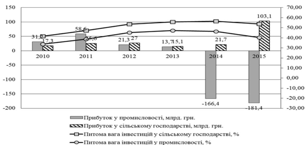
Рис. 2. Динаміка прибутку і питомої ваги капітальних інвестицій у промисловості та сільському господарстві України у 2010-2015 роках, % Джерело: складено та розроблено автором на основі [15]

Порівняємо фінансові результати діяльності промисловості та сільського господарства України у 2010-2015 роках (Рис. 2) [15].