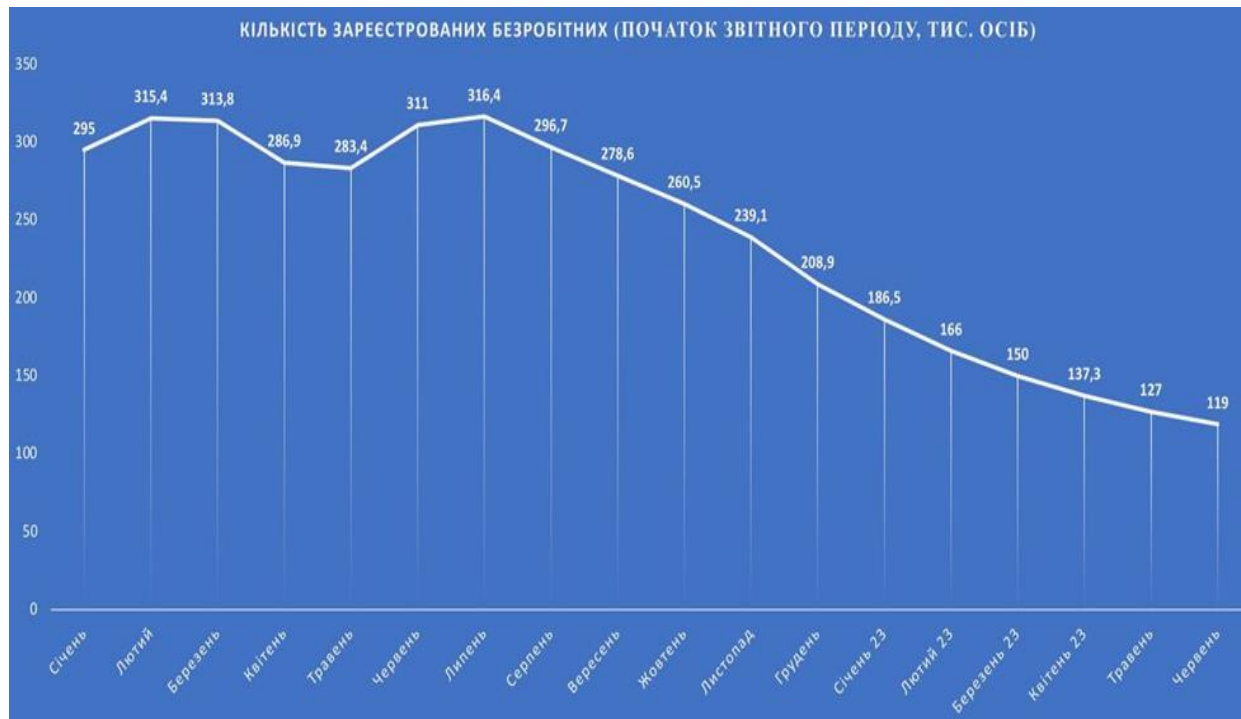
Рисунок 1 - Динаміка кількості зареєстрованих осіб на біржах праці в Україні, 2022-2023 роки. [1]

Трудовий ресурс є однією з вирішальних складових частин економіки країни. На сьогоднішньому етапі потреба галузей у кадрах та можливості реалізації інтересів спеціалістів визначаються воєнними умовами в Україні. Ринок праці в Україні після початку великої війни справді суттєво скоротився: з країни виїхали 6,2 млн українців. Частина громадян стали на захист країни і не беруть активної участі в економічній діяльності, понад 4 млн знаходяться в окупації, багато хто загинув. Все це негативно позначилося на стані вітчизняного ринку праці. Офіційна кількість українців, які зареєструвалися на біржі праці, востаннє збільшилася до липня 2022 року. (рисунк 1)