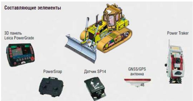
Рисунок 1 - комплекс Leica PowerGrade [1]

Системи автоматичного нівелювання Leica PowerGrade для грейдерів і бульдозерів (рис. 1) - це програмно-апаратний комплекс, що використовує геодезичні автоматизовані технології тахеометрії і GPS технології, а також різні типи датчиків, для забезпечення часткової автоматизації виконання робіт. Тобто це набір додаткових датчиків, гідравліки та елементів контролю та управління, що забезпечує установку робочих елементів машини в просторі так, як цього вимагає завдання або проект.