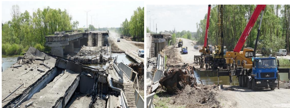
Рисунок 3 – Міст через річку Тетерів

Іванків. ЗСУ підірвали міст через Тетерів, щоб затримати техніку окупантів біля Києва. Зараз роботи по відновленню мосту тривають.