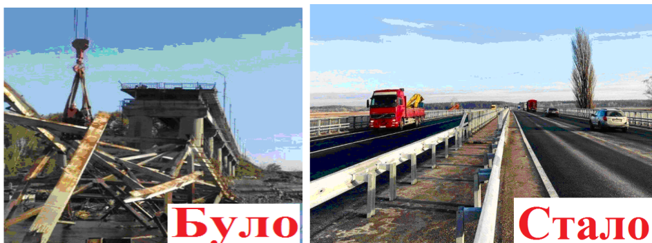
Рисунок 10 – Міст на дорозі М-03 Київ – Харків – Довжанський через річку Трубіж