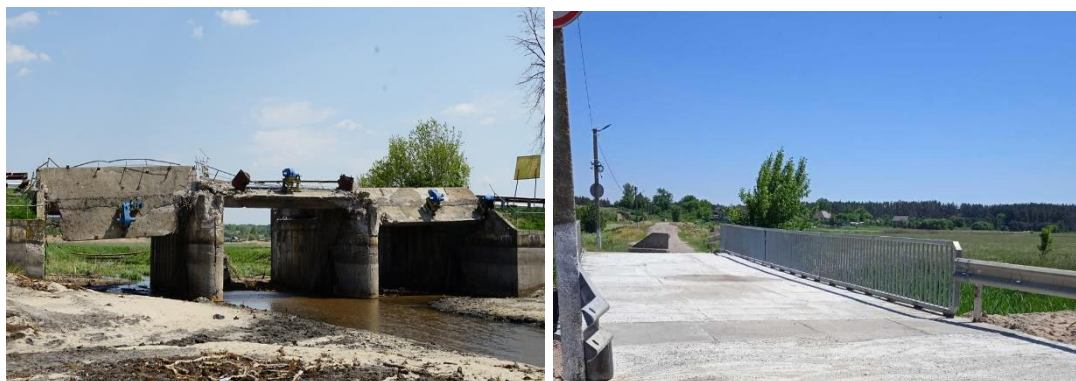
Рисунок 4 - Міст через Жереву із Закарпаття

Жеревпілля. Орки, з виключною тупістю та жорстокістю, тікаючи «за поребрік» загнали на міст Урал, завантажений боєприпасами, і підірвали його.