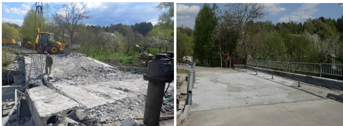
Рисунок 5 – Міст через річку Лупа

Дідівщина. В селі Дідівщина Фастівського району міст через річку Ірпінь було частково зруйновано під час бойових дій.