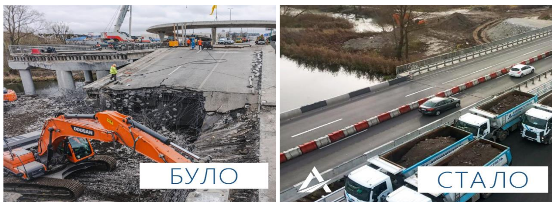
Рисунок 7 - Міст на дорозі М-06 Київ–Чоп у Стоянці