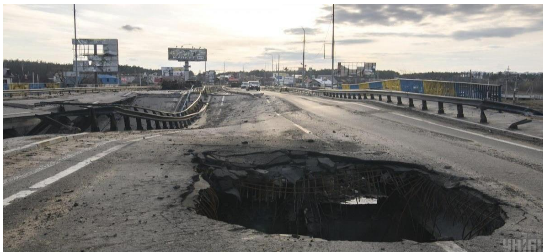
Рисунок 8 - Міст на дорозі М-07 Київ–Ковель–Ягодин у Гостомелі

Міст на дорозі М-07 Київ–Ковель–Ягодин у Гостомелі. Селище Гостомель, що у Бучанському районі Київської області, тривалий час обстрілювали російські окупаційні війська. Як наслідок, населений пункт майже зруйнований і тому числі міст.