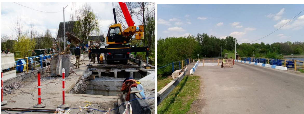
Рисунок 6 - Міст через річку Ірпінь

Дідівщина. В селі Дідівщина Фастівського району міст через річку Ірпінь було частково зруйновано під час бойових дій.