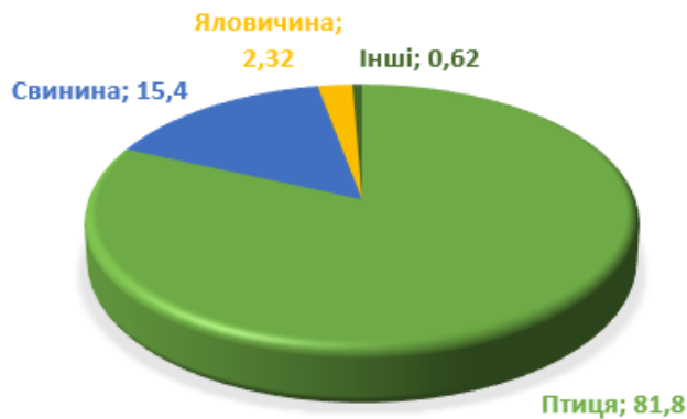
Рисунок 2. Структура виробництва різних видів м'яса в Україні в 2023 році