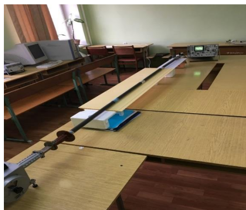
Рисунок 2– Общий вид измерительной установки

Компенсация потери мощности прошедшей волны за счет ее деполаризации устранялась путем поворота устройства сопряжения вокруг