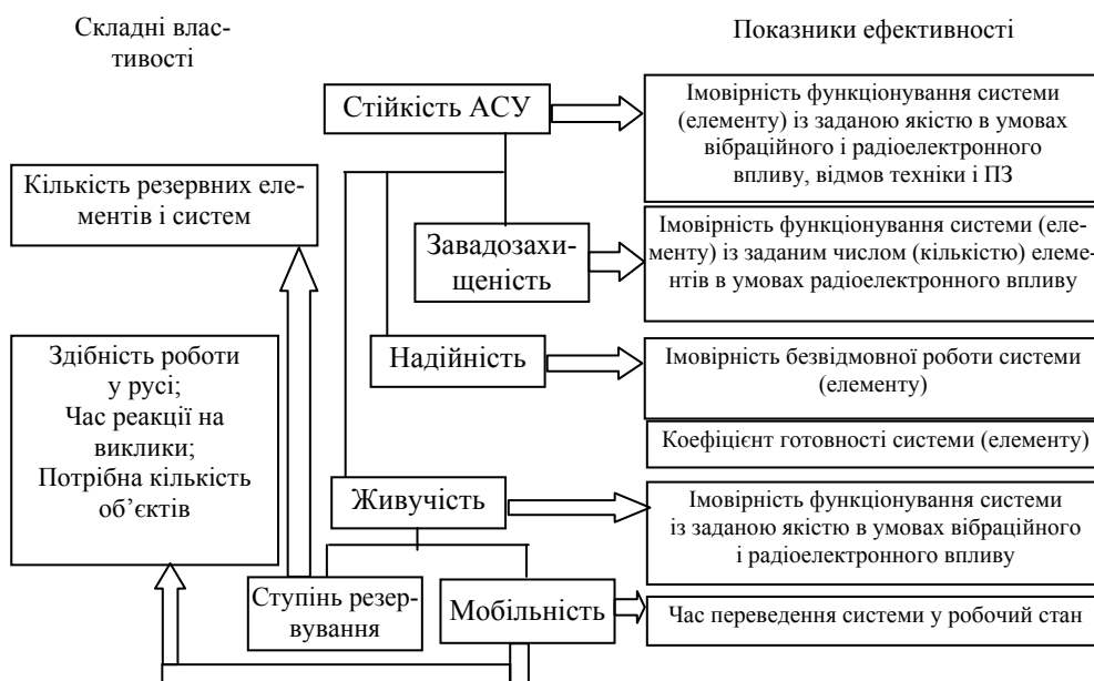
Рис. 2. Основні властивості стійкості АСУ

У якості основного показника стійкості АСУ доцільно вибрати імовірність функціонування системи (елемента) із заданою якістю в умовах вібраційного і радіоелектронного впливу, а також відмов техніки і програмного забезпечення (ПЗ). Така система (кожний елемент) складається із комплексу засобів автоматизації (технічних засобів) і обслуговуючого персоналу.