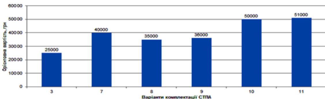
Рисунок 8 – Орієнтовна вартість варіантів комплектації СТПА ДГД