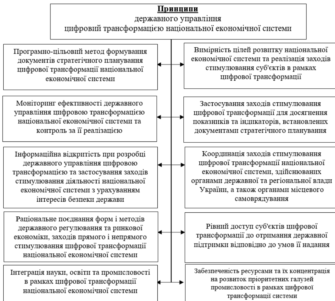
Рис. 4. Принципи державного управління цифровою трансформацією національної економічної системи