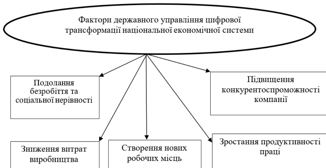
Рис. 1. Фактори державного управління цифровою трансформацією національної економічної системи

У доповіді Світового банку про міжнародний розвиток перераховані переважні фактори державного управління 8 , одержувані від цифрової трансформації національної економічної системи (рис. 1) [6].