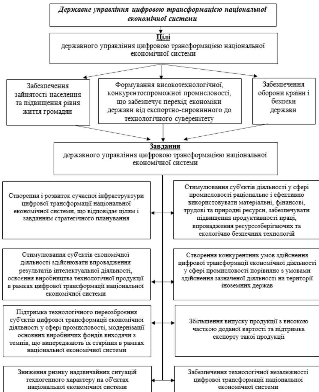
Рис. 2. Цілі та завдання державного управління цифровою трансформацією національної економічної системи

Врахування та виконання факторів (рис. 1) дозволяє подолати територіальні обмеження і залежність виробництв від розташування постачальників. Поширення мережевих ефектів змінює ланцюжки створення вартості і формує нові моделі ведення бізнесу. Сформулюємо основні цілі, завдання та принципи державного управління цифровою трансформацією національної економічної системи (рис. 2).