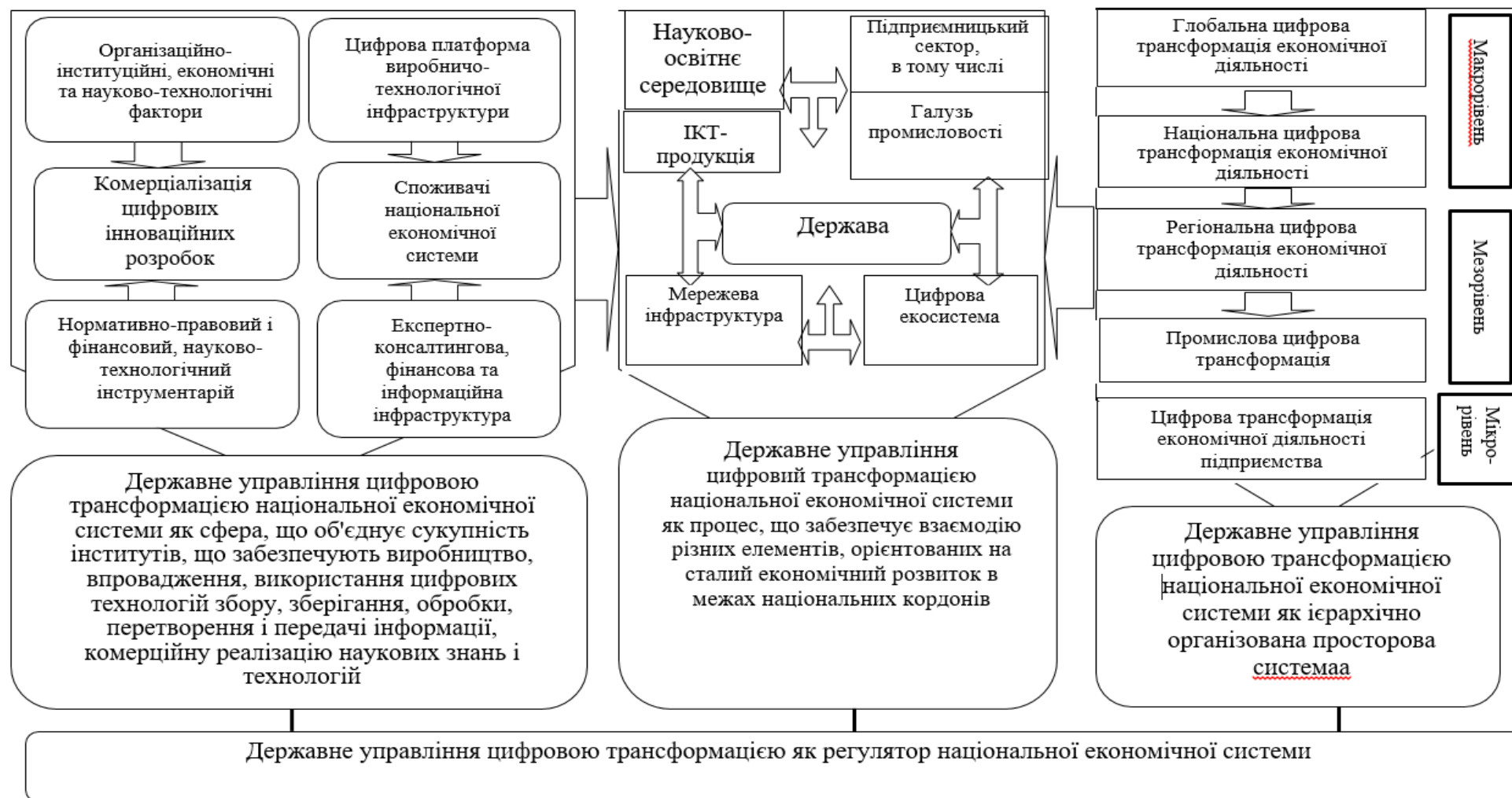
Рис. 5. Концептуальна комплексна модель державного управління цифровою трансформацією національної економічної системи