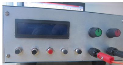
Рисунок 1 – Зовнішній вигляд джерела живлення

Робота джерела живлення розділена на два основні режими: імпульсний і безперервний. Імпульсний режим вирішує основну задачу приладу. Вихідний сигнал можна перебудувувати по частоті, формі імпульсу і коефіцієнту пульсації. Результати вимірювань, проведені з використанням розробленого приладу, були зареєстровані на цифровому осцилографі і представлені на рисунку 2.