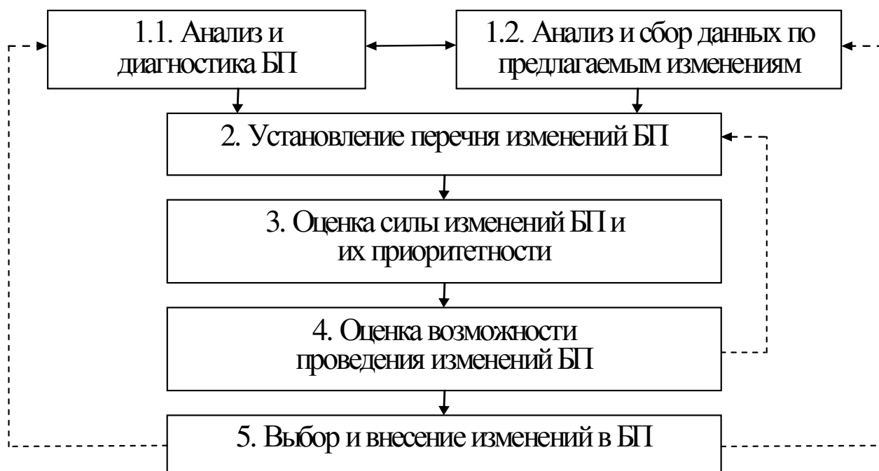
Рис. 1. Схема внесения изменений в бизнес-процессы

Анализ и диагностика БП (этап 1.1) предполагают установление фактического состояния БП (показателей качества, стоимости, времени реализации т.п.). Для этого могут применяться различные методы: экспресс-анализа, квалиметрической оценки [17] и т. д. В результате их применения необходимо выявить процессы, нуждающиеся в улучшении, а также определить, в чем состоят «узкие места» БП или их проблемность. В работе [18] определен ряд универсальных проблем, которые могут быть присущи любому БП: