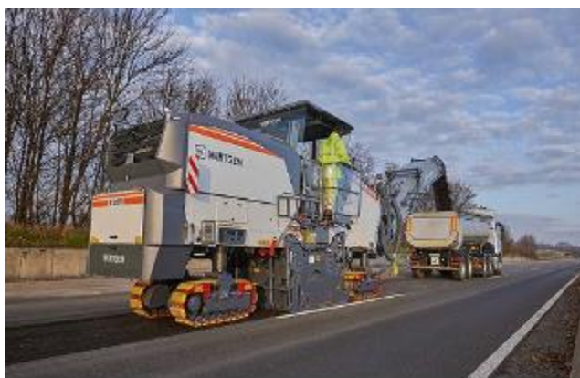
Рисунок 1 – Дорожня машина з інтелектуальною системою управління

Будівельна інтелектуальна машина є багаторівневою системою, що складається з різномірних компонентів (рис.1.).