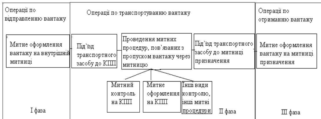
Рис. 2 – Фазова технологічна схема процесу митної переробки вантажів

Важливими показниками при доставці вантажів у міжнародному сполученні виступають годинні показники по кожній групі операцій, які безпосередньо впливають на загальний час доставки продукції від виробника до споживача. Для прикладу розглянемо структурно-логічну схему процесу митної переробки вантажів (рис.2).