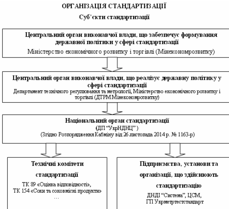
Рис. 2. Організація стандартизації в Україні згідно нової редакції Закону України «Про стандартизацію».