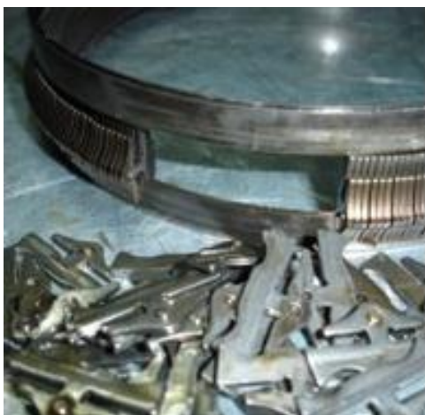
Рис.4 Розрив пасу варіатора

Ремонт АКПП дуже складна робота, адже кожна деталь є унікальна і має свою назву. Наприклад «Барабан Direct», «Center Support». Розглянемо на прикладі АКПП Hyundai Accent (A4AF3). Основна проблема цих АКПП це падіння тиску оливи, і із-за цієї проблеми дуже часто горять фрикціонні кільця матеріал від яких потрапляє в гідроблок. Також основна проблема це слабкі підшипники диференціалу які не витримують великі навантаження, також одна з проблем коли на автомобілі великий пробіг частий витік оливи та слабку проводку соленоїдів.