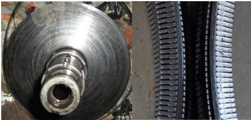
Рис.2 Подряпини від металічного пасу на конусах варіатора, знос робочої поверхні пасу варіатора