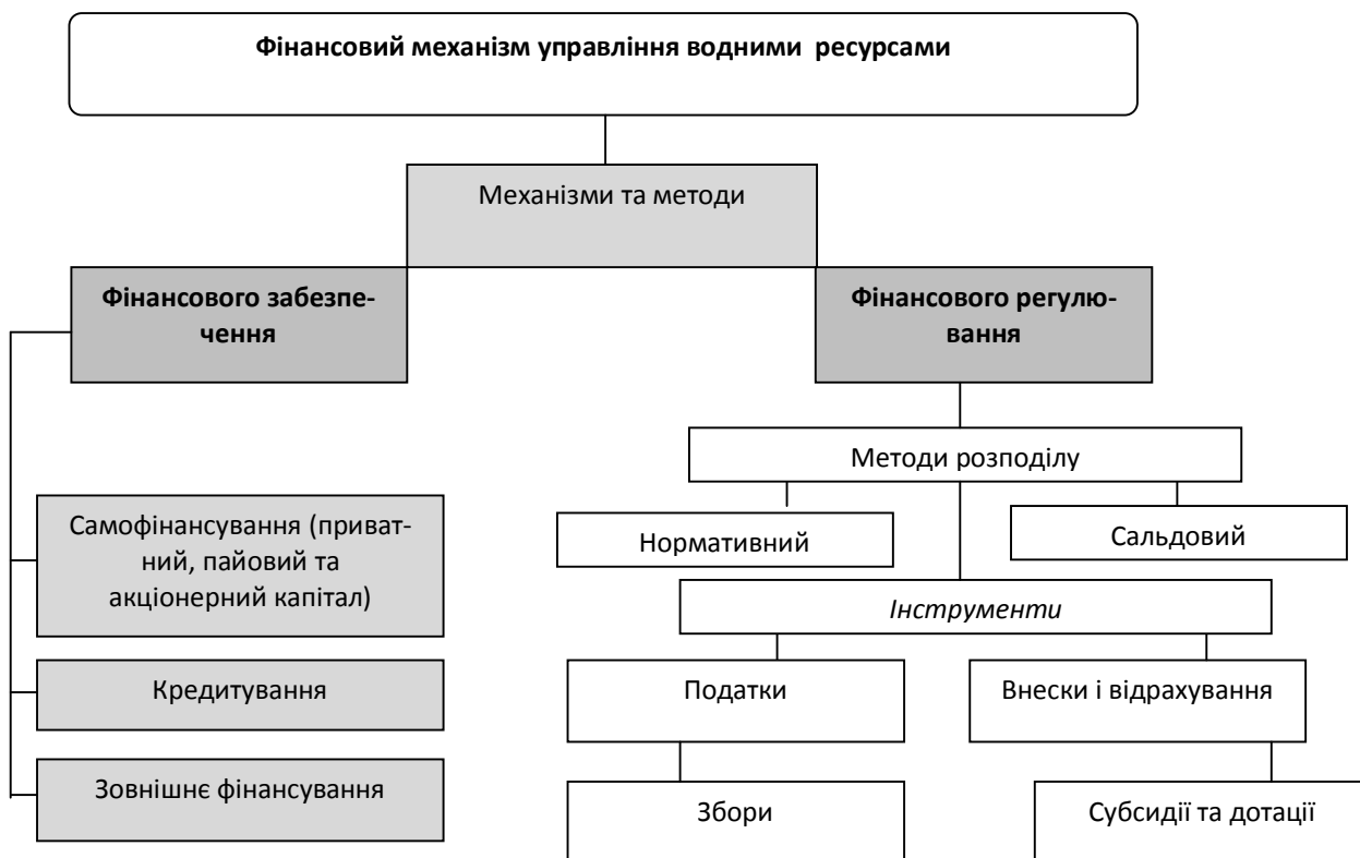
Рисунок 1 – Загальна структура механізму фінансово-економічного забезпечення водогосподарської діяльності

Незважаючи на те, що в Україні доволі активно проходять процеси трансформації інститутів командно-адміністративної економіки в ринкові, водокористування характеризується гіпертрофованістю саме системи фінансового регулювання водних ресурсів як у сфері управління ними, так і господарського освоєння водноресурсного потенціалу та перерозподілу водних ресурсів. Узаконення та впровадження сучасних ринкових фінансових механізмів регулювання водогосподарської діяльності, які вже давно функціонують у сфері водного господарства у країнах з розвинутою ринковою економікою у, є вимогою часу, оскільки лише за таких умов можна якісно підвищити вплив водного фактору на темпи соціально-економічного піднесення, включити водні ресурси в систему формування територіальних природо-ресурсних капіталів.