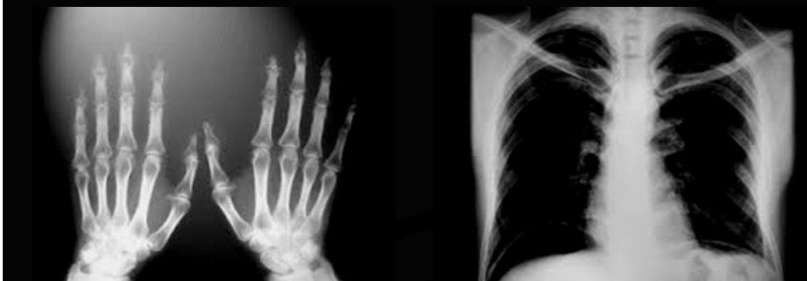
Рис. 3. Открытие X-лучей И. Пулюем

И. Пулюй проанализировал природу и механизмы возникновения X-лучей и получил с их помощью качественные снимки человеческого скелета. Его работы были опубликованы.