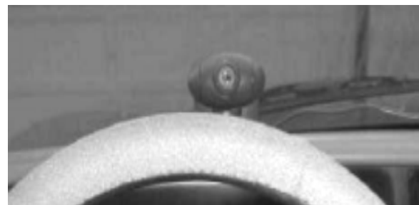
Рис. 4. Расположение камеры

В ходе эксперимента, сутью которого было получить различия между открытыми и закрытыми глазами водителя, были получены следующие результаты. Видеокамера была закреплена на лобовом стекле автомобиля (рис. 4).